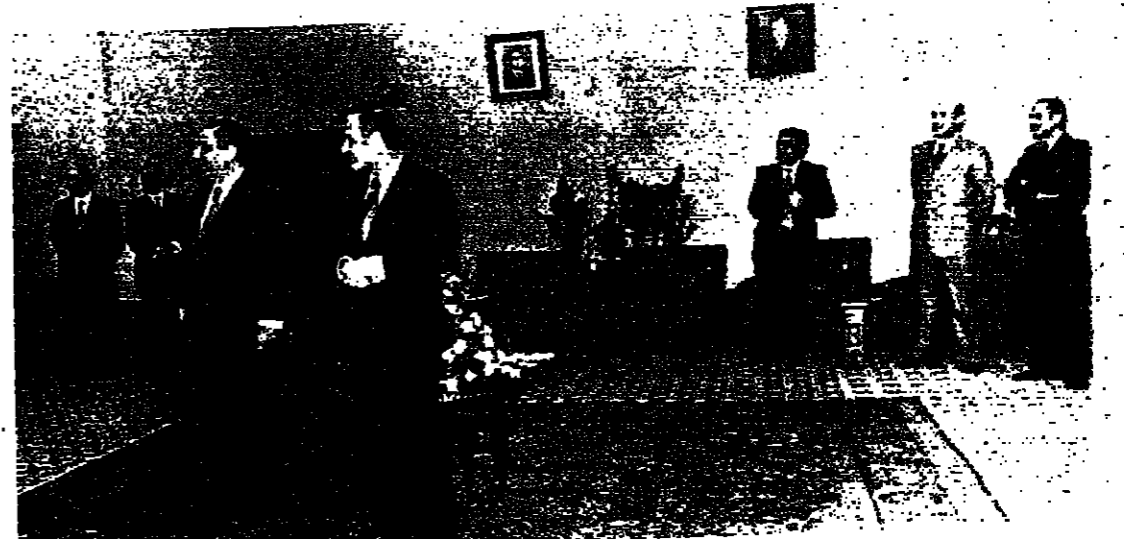
الرئيسان سركيس والاسد خلال استقبالها الدبلوماسيين

رأسها الوفاء الوطني وبناء القوات المسلحة ، والرأي يخلق بين الجميع بأن أي عمل لا يمكن ان يقدم عليه الدولة ان تلحمة بناء الجيش او بحث المؤسسات الاخرى لا يبعد اعلان الوفاق الوطني . وإذا كان الوفاق الوطني هو بالنتيجة شأن لبناني فله لا بد من الاشارة الى ان سوريا ترى ان البلدين المتجاورين اللذين أمضيا تاريخاً مشهوراً بالنسبة لخلافتهم التقليدية لم يكن السماع وطبعاً في إطار التنسيق باستمرار هذا التباين التقني الذي يؤدي في معظم الحالات الى خلافات تتمسك على كافة العلاقات الجنية والسياسية والاقتصادية والاجتماعية . وهذا الامر يتحدث عنه السوريون ويعتبرون عليه الاهمية الكبرى لأنه بالنتيجة يعتبر موقفاً مصيرياً لهم ولحكومتهم . أما بناء الجيش فهو موضوع مصري بالنسبة للبنان فنسوريا لا تستطيع ان تستمر في ضمان أمن لبنان بجيشها المتواجد هنا ، ولكن بناء الجيش له مقومات اهمها اولاً ان يعلن الوفاق الوطني وثانياً ان يكون قادراً في مرحلة ولانته الاولى على منع قيام الفتنة البقية على الصفحة 4